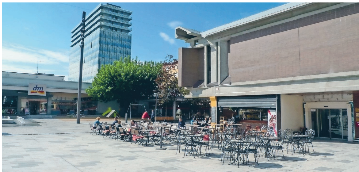
Nova, čista fasada stavbe, v ozadju pa Eda center, ki naj bi napovedoval prihodnost Nove Gorice, a je zaradi gospodarske krize ostal zamrznjen v času in bolj ali manj prazen.